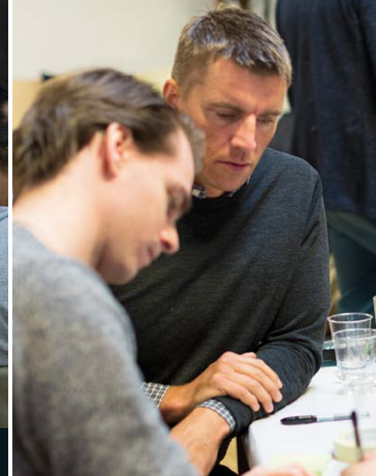
Bildene er fra Social Startups bootcamp i januar 2018.