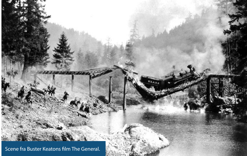
Scene fra Buster Keatons film The General .

I den ene ende af den vertikale akse er risikoen, at vi får et akademisk system, der i stigende grad lukker sig om sig selv og kun opererer ud fra snævre videnskabsin-