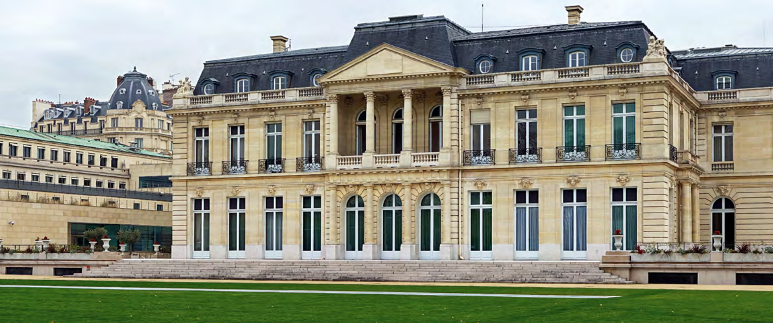
Château de la Muette, OECDs ærverdige lokaler i Paris' 16. arrondissement.